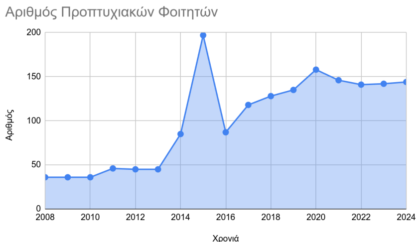
Εικόνα 1: Εξέλιξη του αριθμού των εισερχόμενων φοιτητών στο ΠΠΣ

Στην Εικόνα 1 φαίνεται ο αριθμός των νεοεισερχόμενων φοιτητών στο προπτυχιακό πρόγραμμα σπουδών. Στο πρόγραμμα λειτουργεί και δέχεται φοιτητές τα τελευταία 17 έτη, στα οποία έχουν εγγραφεί συνολικά 962 προπτυχιακοί. Η συντριπτική πλειοψηφία των αποφοίτων του Τμήματος εργάζονται στον ιδιωτικό τομέα, προσφέροντας κυρίως στην ανάπτυξη εφαρμογών σε σύγχρονα περιβάλλοντα (Web, mobile, cloud), και στη διαχείριση και ανάλυση δεδομένων. Επίσης, προσφέρουν έργο ως διαχειριστές συστημάτων σε εταιρείες λογισμικού και άλλους οργανισμούς. Κάποιοι απόφοιτοι προσλαμβάνονται επίσης και σε εκπαιδευτικούς οργανισμούς ενώ αξιοσημείωτο είναι ότι κάποιοι έχουν ξεκινήσει τις δικές τους νεοφυείς επιχειρήσεις. Όλοι σχεδόν οι απόφοιτοι βρίσκουν εργασία μέσα σε 6 μήνες από τη στιγμή που θα μπουν στην αγορά εύρεσης εργασίας. Πάνω από τους μισούς απόφοιτους του Τμήματος συνεχίζουν τις σπουδές τους για μεταπτυχιακούς τίτλους, ενώ το 30% να συνεχίζει στο εξωτερικό, κατά κύριο λόγο στη Μεγάλη Βρετανία, τη Γερμανία, την Ολλανδία και τη Γαλλία, ωστόσο υπάρχουν και κάποιοι που προτιμούν τις ΗΠΑ, τον Καναδά και την Αυστραλία. Πολλοί απόφοιτοι έχουν πάρει υποτροφίες για τη συνέχιση των σπουδών τους σε μεταπτυχιακό επίπεδο, και σε επίπεδο διδακτορικού. Τα ανωτέρω στοιχεία βασίζονται στην αναλυτική μελέτη με ποσοστό συμμετοχής που ξεπέρασε το 40% των αποφοίτων και πραγματοποιήθηκε το 2021-22 από τη Γραμματεία του Τμήματος